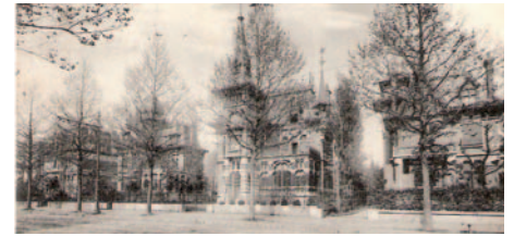
villa St Georges à Lambersart

Bientôt, à Quesnoy-sur-Deûle comme à Lambersart, Saint-André et Wambrechies, vous allez pouvoir partir en promenade virtuelle dans votre commune sans bouger de chez vous, en vous connectant simplement sur l'Historioscope de votre ville ou de votre village. Les autres communes du SIVOM auront également prochainement leur Historioscope, le projet ayant été programmé en 2 phases. L'Historioscope est une initiative du SIVOM Alliance Nord-Ouest pour vous faire découvrir d'abord de chez vous, puis sur le terrain si vous le souhaitez, des circuits patrimoniaux qui vous racontent l'histoire de votre commune. Sur le site internet, chaque circuit est représenté par un plan où s'agitent des petits drapeaux, ceux-ci vous signalent les sites à caractère historique dont l'Historioscope vous présente une brève histoire. Si vous cliquez sur l'un des petits drapeaux, vous découvrirez un commentaire historique illustré par deux photos prises sous le même angle, l'une prise aujourd'hui, l'autre il y a 100 ans. Le SIVOM a confié la réalisation des Historioscopes à la société ARTSNCOM et prend en charge les prestations de création. Le droit d'exploitation et de maintenance annuelle